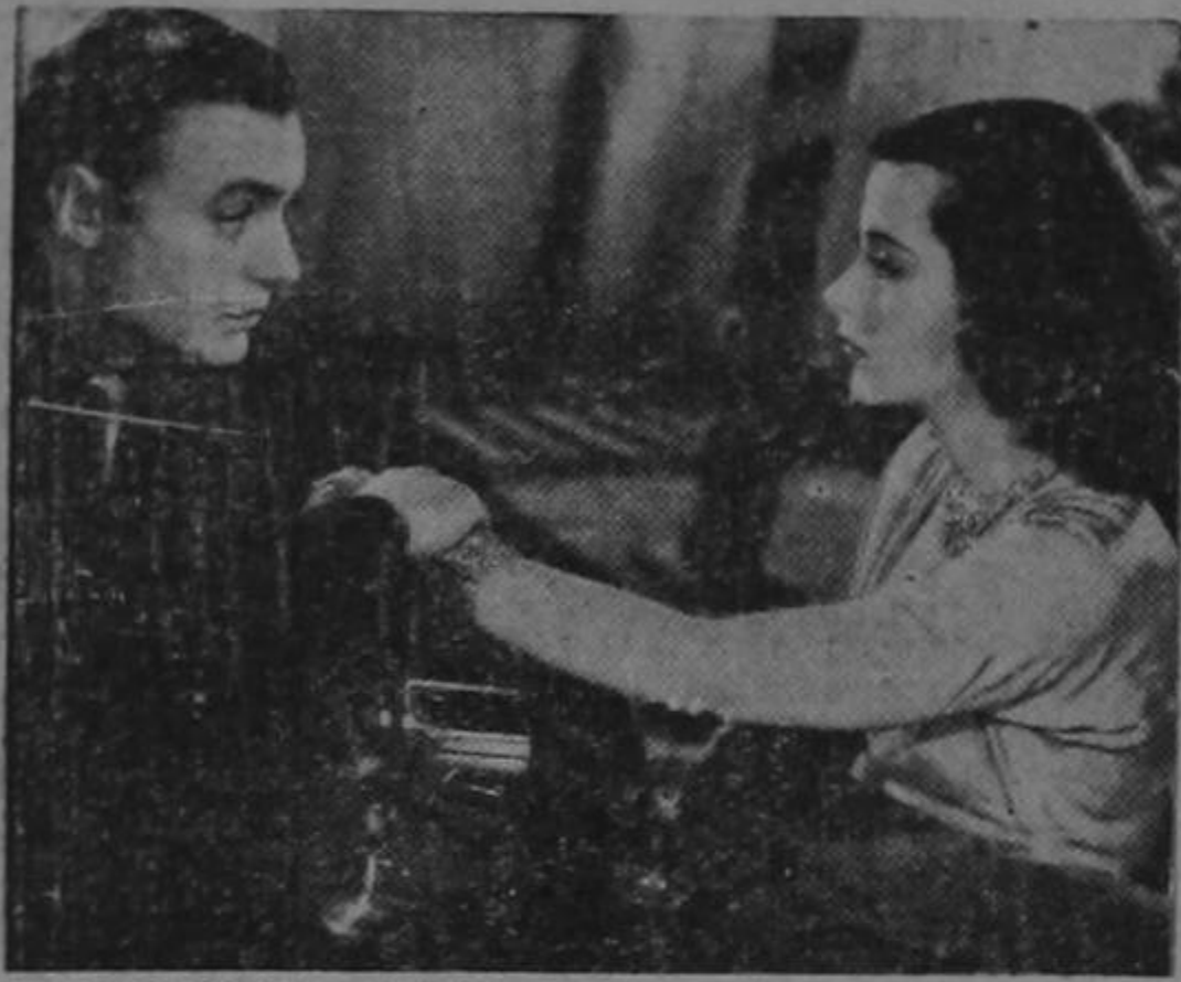
CHARLES BOYER y HEDY LAMARR en una emocionante escena de la producción de Walter Wanger, "Argel". Distribuida por United Artists.

EDGAR ODIO GONZALEZ RODRIGO ODIO GONZALEZ