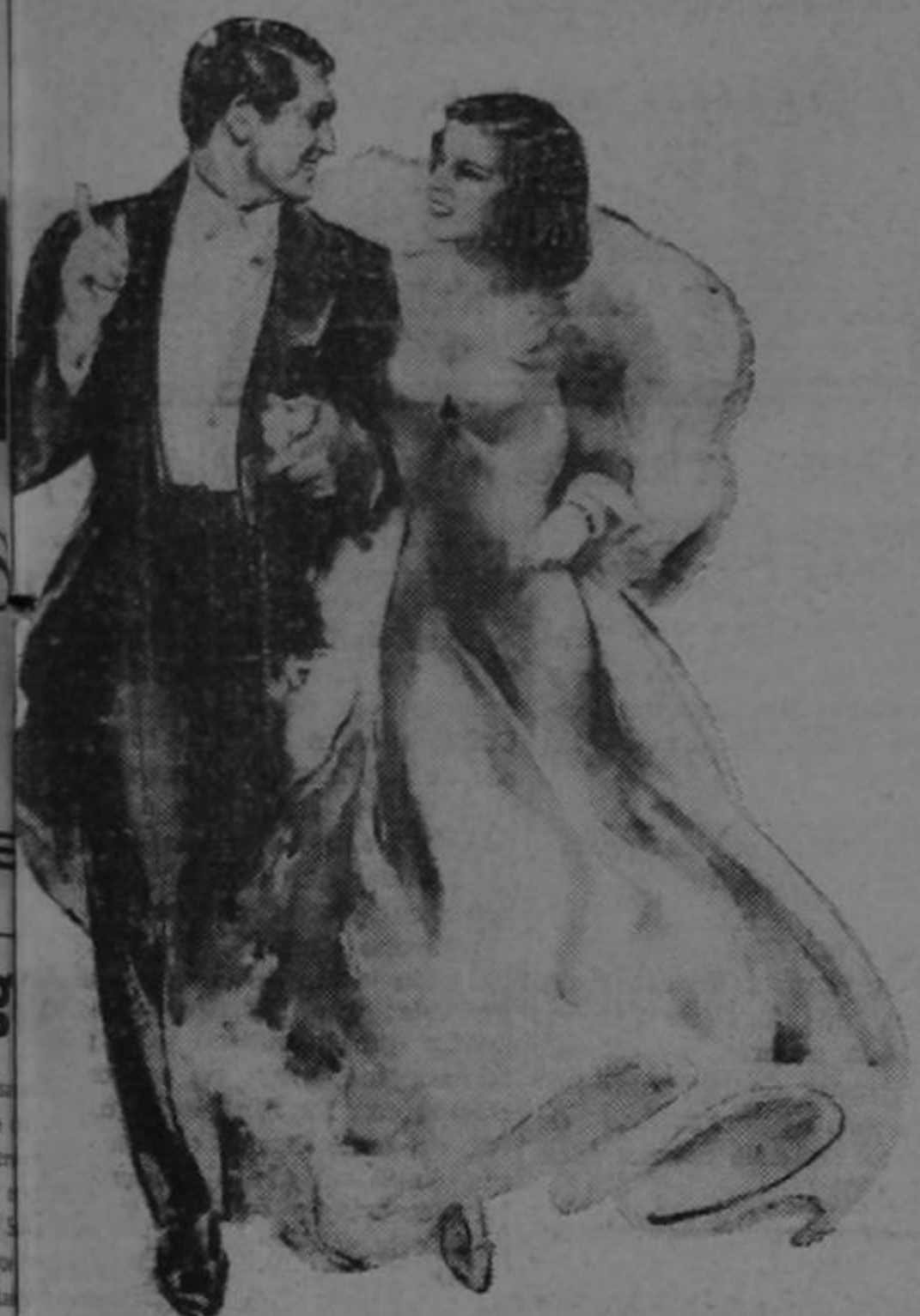
Katharine Hepburn y Cary Grant, los protagonistas de VIR PARA GOZAR, son miembros "rebeldes" de una edad que afirma que, para gozar de la vida, hay que ir libremente, abandonando con su fuga los lujos y conveniencias sociales de la vida de Park Avenue.