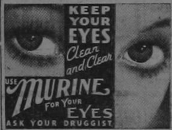
KEEP YOUR EYES Clean and Clear. USE MURINE FOR YOUR EYES. ASK YOUR DRUGGIST.

Should this proposal prosper, the need of the roadway for this city to Moin, by way of Portete and the Cemetery, will be a vital necessity. It may be stated that the canalization scheme has already been approved by Congress and one cent of the two cent Export Tax on all Bananas sent out the Republic by way of this Port is earmarked for defraying the expenses. As President Cortes is known to be personally interested in the project, we hope to see an early movement for the starting of the work.